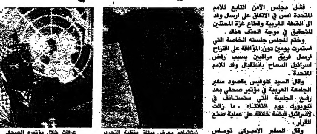
عرفات خلال مؤتمره الصحفي (البيقة على الصفحة 9)

فشل مجلس الأمن التابع للأمم المتحدة أمس في الاتفاق على ارسال وفد الى الضفة الغربية وطابع غزة للتحقيق في موجه العنف هناك. وخطت لمجلس جلسته الخاصة التي استمرت يومين دون الموافقة على اقتراح ارسال فريق مراقبين بسبب رفض اسرائيل السماح باستقبال وفد للأمم المتحدة. وقال السيد كلوفيس مقصود مدير الجامعة العربية في مؤتمر صحفي بعد رفع الجلسة التي استضافت في نيويورك يوم الثلاثاء، ما زالت إسرائيل قبضة متينة على الضفة الغربية للقرار.